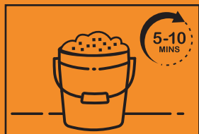
4. 攪拌好後閒置一會