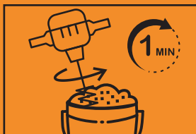
5. 使用前再略為攪拌